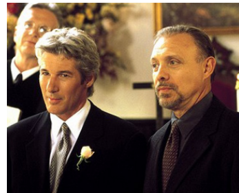
1999 JUST MARRIED (OU PRESQUE) (Runaway Bride) de Garry Marshall avec Richard Gere