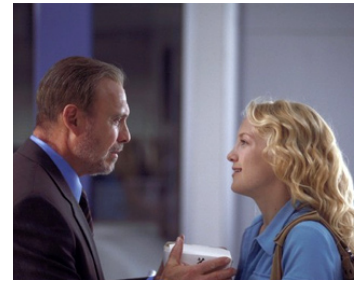
2004 FASHION MAMAN (Raising Helen) de Garry Marshall avec Kate Hudson