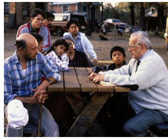
1991 LE FLEUVE DE L'OUBLI (Finding the Way Home) de Rod Holcomb avec George C. Scott