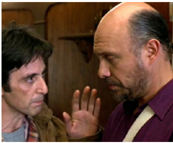
1991 FRANKIE ET JOHNNY (Frankie and Johnny) de Garry Marshall avec Al Pacino