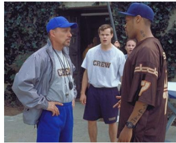
2001 HOW HIGH de Jesse Dylan avec Chris Elwood, Redman