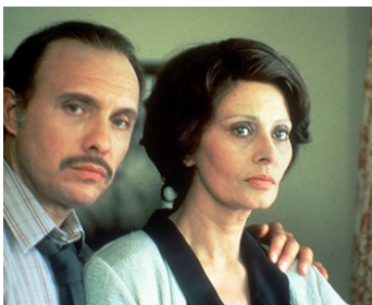
1986 SEULE CONTRE LA MAFIA (Confiance) de Jeremy Paul Kagan avec Sophia Loren