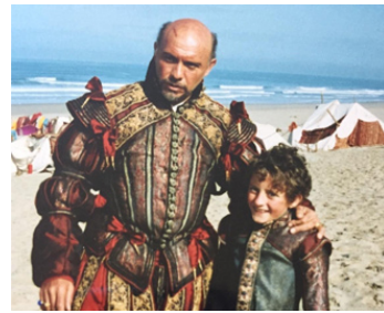
1993 LE SECRET DU BONHEUR (Being Human) de Bill Forsyth