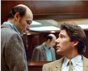
1980 AMERICAN GIGOLO (American Gigolo) de Paul Schrader avec Richard Gere