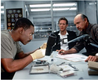
1994 LE FLIC DE BEVERLY HILLS 3 de John Landis avec Eddie Murphy, Judge Reinhold