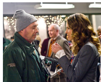
2011 HAPPY NEW YEAR (New Year's Eve) de Garry Marshall avec Hilary Swank