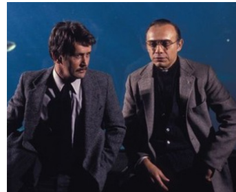
1985 UN TUEUR DANS NEW YORK (Out of the Darkness) de Jud Taylor avec Martin Sheen