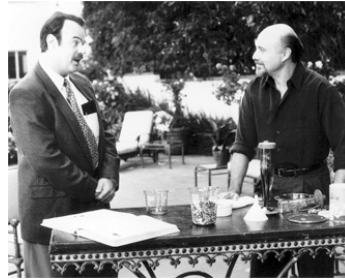
1994 CLUB EDEN, L'ÎLE AUX FANTASMES (Exit to Eden) de G. Marshall avec D. Aykroyd