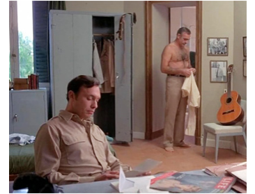
1979 CUBA (Cuba) de Richard Lester avec Sean Connery