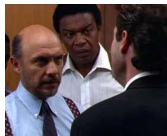
1991 RÉCLUSION À MORT (Chains of Gold) de Rod Holcomb avec Bernie Casey, J. Travolta