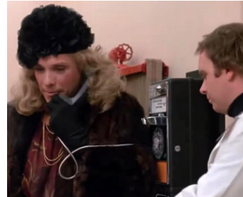
1982 DOCTORS IN LOVE (Young Doctors in Love) de Garry Marshall avec Patrick Collins