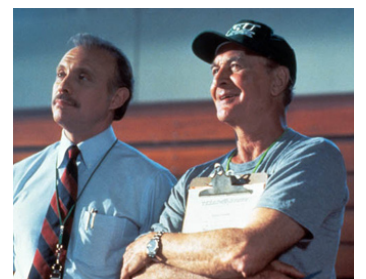
1991 L'ÉQUIPE DES CASSE-GUEULE (Necessary Roughness) de Stan Dragoti avec Robert Loggia