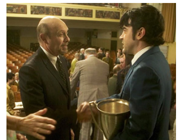
2007 MUSIC WITHIN (Music Within) de Steven Sawalich avec Ron Livingston