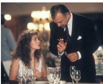
1990 PRETTY WOMAN (Pretty Woman) de Garry Marshall avec Julia Roberts