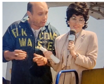
1987 UN COUPLE À LA MER (Overboard) de Garry Marshall