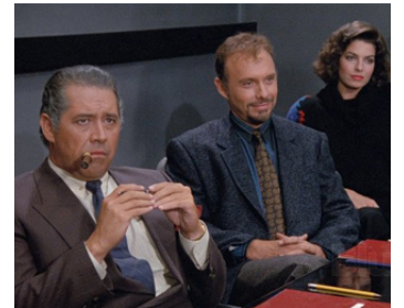
1986 RIEN EN COMMUN (Nothing in Common) de G. Marshall avec Jackie Gleason, Sela Ward