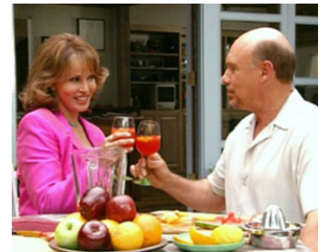
2001 TORTILLA SOUP (Tortilla Soup) de Maria Ripoll avec Raquel Welch