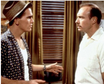
1984 LE KID DE LA PLAGE (The Flamingo Kid) de Garry Marshall avec Matt Dillon