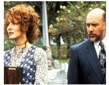
1994 BACKSTREET JUSTICE de Chris McIntyre avec Linda Kozlowski