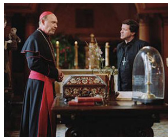
2006 LA PROPHÉTIE DES ANDES (The Celestine Prophecy) d'A. Mastroianni avec J. de Almeida