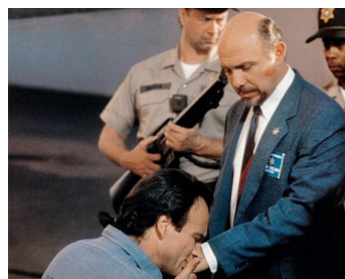
1990 FILOFAX (Taking Care of Business) d'Arthur Hiller avec James Belushi