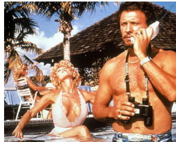
1985 COUPS DE SOLEIL (Private Resort) de George Bowers avec Leslie Easterbrook