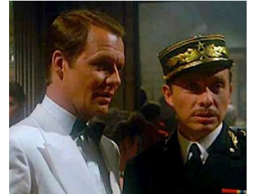
1983 CASABLANCA (Casablanca) de Ralph Senensky avec David Soul