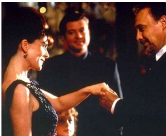
1997 DEUX CŒURS À LOUER (Borrowed Hearts) de Ted Kotcheff avec Roma Downey