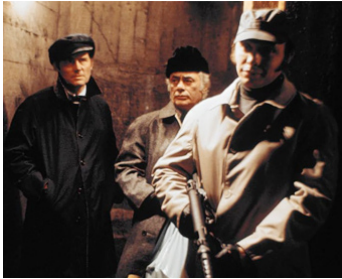
1974 LES PIRATES DU MÉTRO (The Taking of Pelham) de J. Sargent avec R. Shaw, M. Balsam