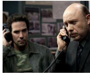
2002 STREET TIME (Street Time) de Marc Levin avec Luke Wilson