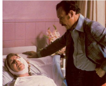
1981 FANATIQUE (The Fan) d'Ed Bianchi avec Maureen Stapleton