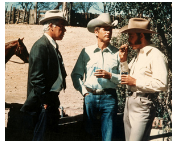
1972 LES INDÉSIRABLES (Pocket Money) de Stuart Rosenberg avec Lee Marvin, P. Newman