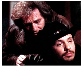
1971 NÉ POUR VAINCRE (Born to win) d'Ivan Passer avec George Segal