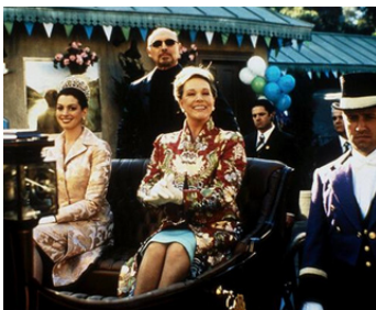
2004 UN MARIAGE DE PRINCESSE (The Princess Diaries 2) de G. Marshall avec A. Hathaway