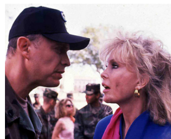
1989 VOTRE MÈRE PORTE DES RANGERS d'Anson Williams avec Barbara Eden