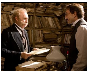
2007 L'AMOUR AUX TEMPS DU CHOLÉRA de Mike Newell avec Javier Bardem