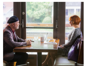
2016 JOYEUSE FÊTE DES MÈRES (Mother's Day) de Garry Marshall avec Julia Roberts