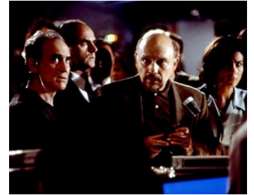
1997 TURBULENCES À 30 000 PIEDS (Turbulence) de Robert Butler avec Jeffrey DeMunn