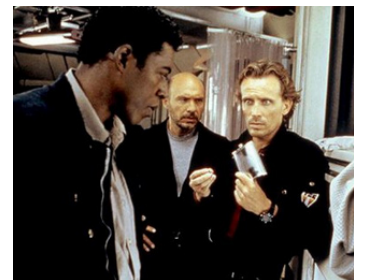
1989 LEVIATHAN (Leviathan) de George Pan Cosmatos avec Ernie Hudson, Peter Weller