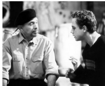
1999 L'AUTRE SŒUR (The Other Sister) de Garry Marshall avec Giovanni Ribisi